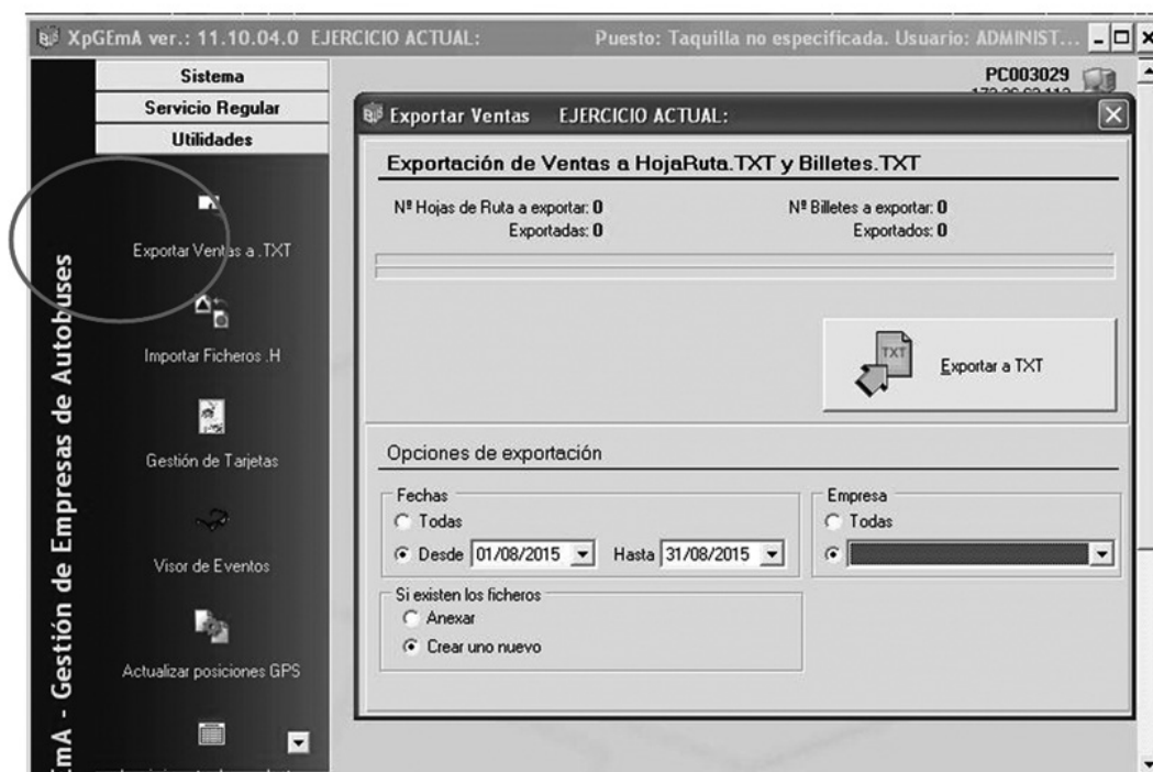
Fig. 2 Exportar Ventas a TXT y al servidor de la Consejería.

Para transmitir datos (Fig. 2), desde el menú de Utilidades, se deberá seleccionar Exportar ventas a TXT.