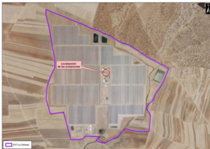
Fig. 2 Localización de la columna de rectificación proyectada.