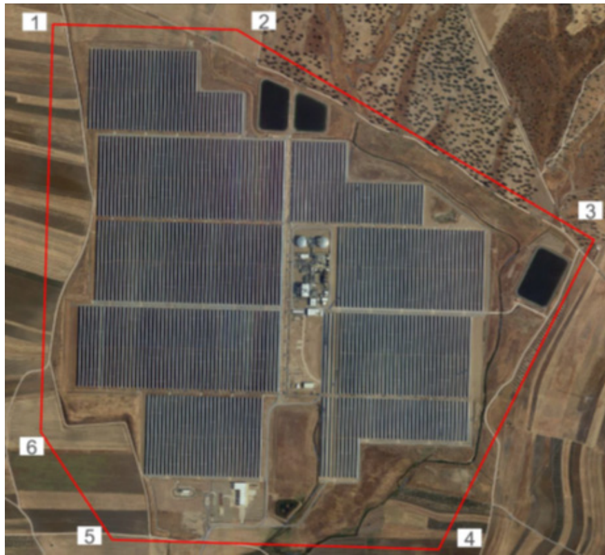
Fig. 1. Localización actuaciones dentro de la Central Solar Termoeléctrica.