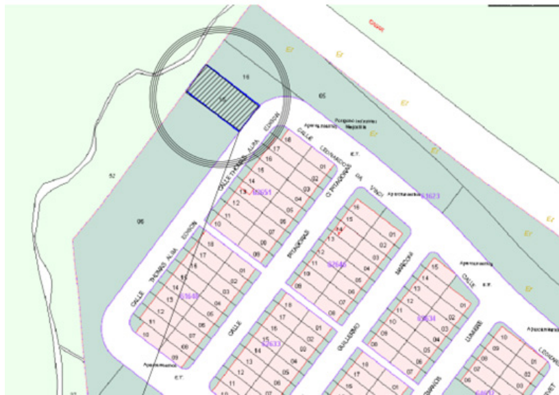
Figura 1: Ubicación

El proyecto presentado se ubica en la calle Thomas Alva Edison n.º 31 del Parque Empresarial La Mejostilla Espadero de Cáceres. Las Coordenadas UTM USO 29 son: X- 726059,20 Y -4376355,25 USO 29.