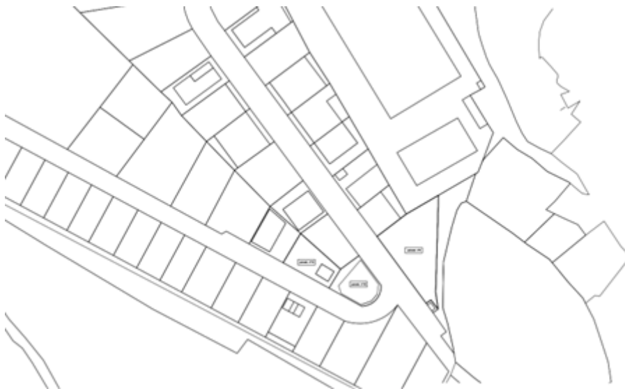
Figura 1: Ubicación