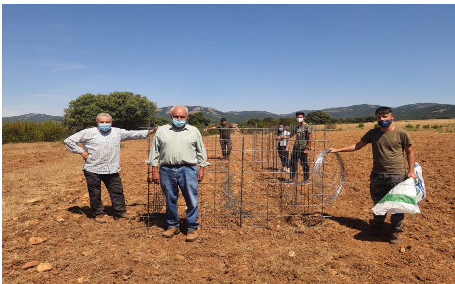
Foto 3. Instalación de un mallazo en una parcela de alimentación en Garlitos, durante el verano de 2021.

Propuesta 6: visitas a cotos que realizan gestión activa y sostenible de la tórtola.