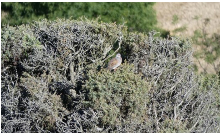
Foto 1. La tórtola en su hábitat típico de reproducción en el Suroeste Peninsular.

Propuesta 2: utilizar cotos que realicen una gestión activa y ejemplar de tórtolas y otras especies para ser utilizadas como casos de éxito y estudio. Para ello se propone seleccionar cotos en los que además de actividades de gestión en investigación, puedan realizarse jornadas de formación dentro del paquete de comunicación que explicaremos más adelante.