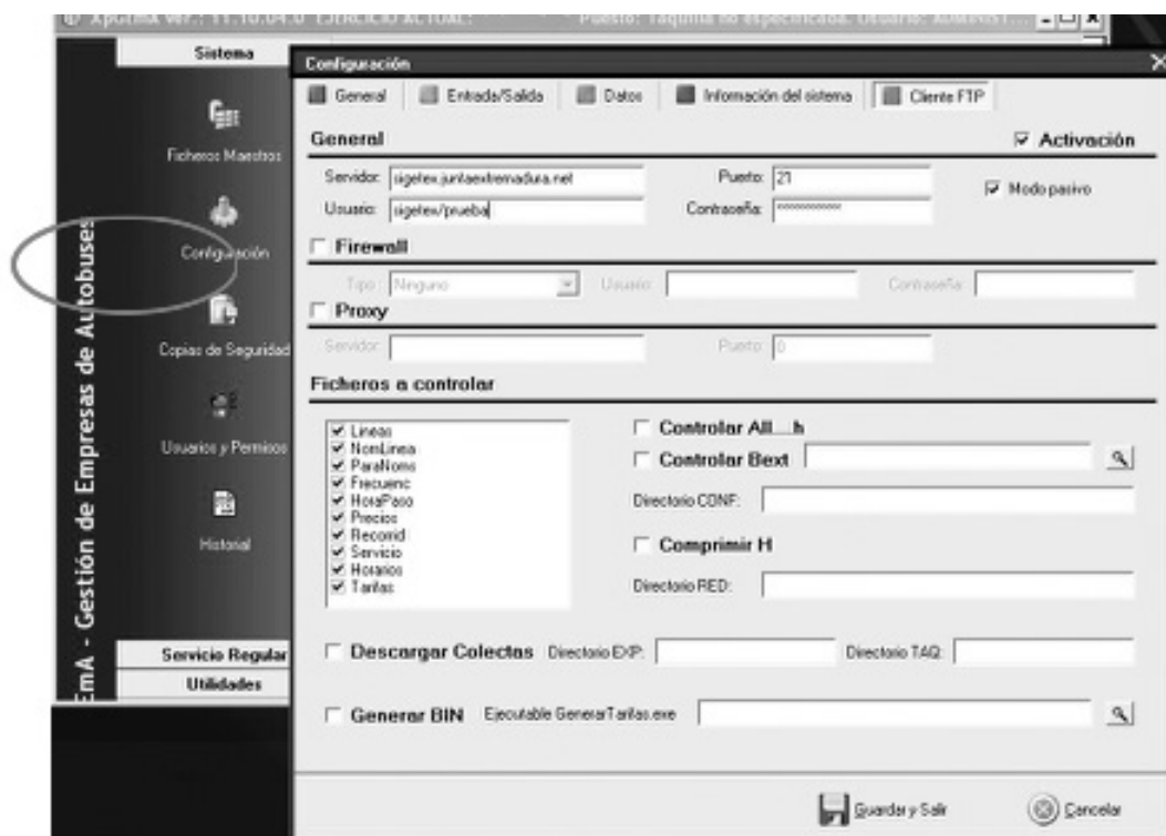
Fig. 1. Configuración de XPGema para transmisión de datos.

(* Excepto si está en blanco, realizar la prueba con los valores por defecto.