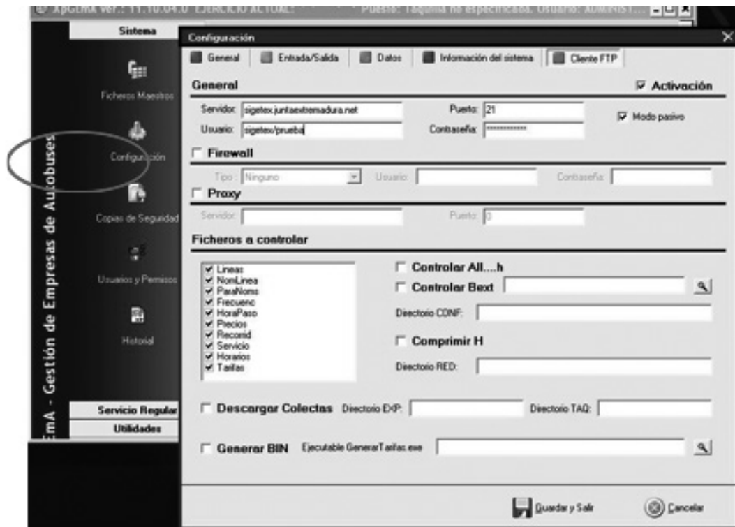
Fig. 1. Configuración de XPGema para transmisión de datos.

(*). Excepto si está en blanco, realizar la prueba con los valores por defecto.