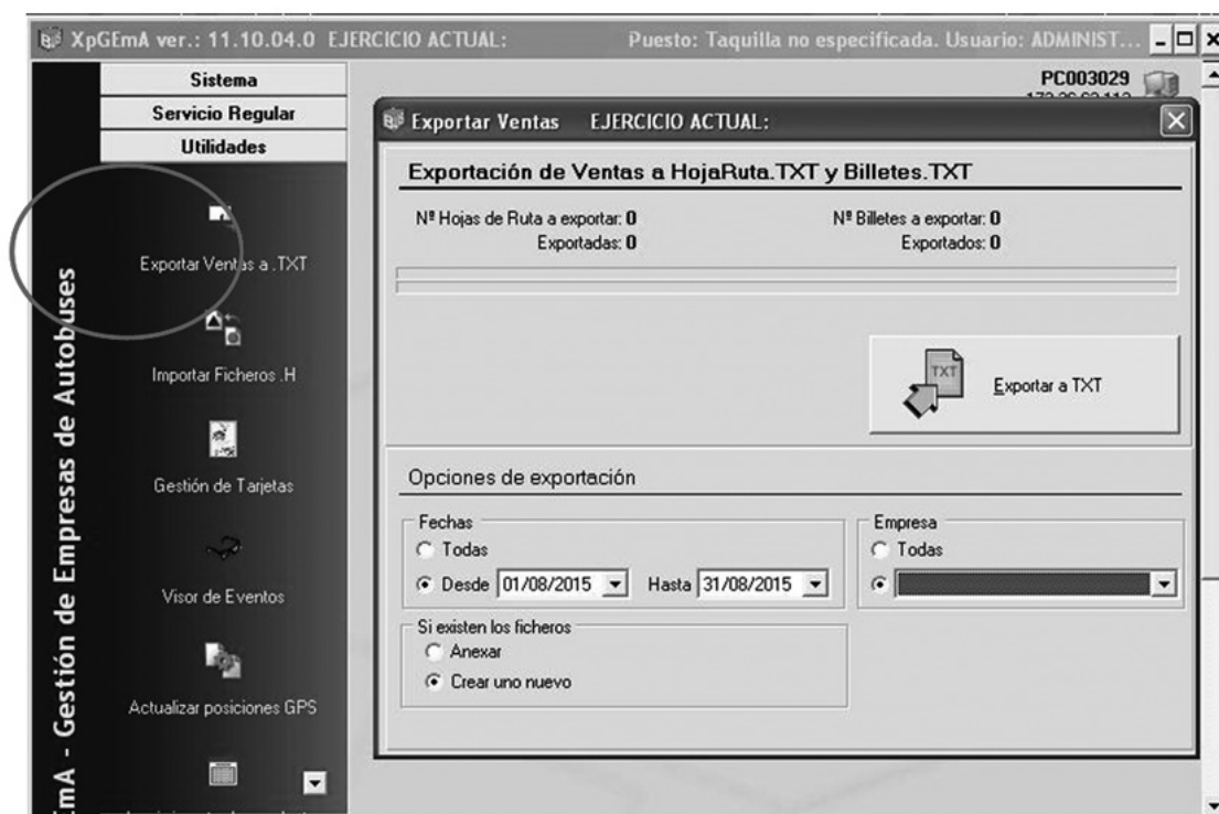
Fig. 2 Exportar Ventas a TXT y al servidor de la Consejería

Para transmitir datos (Fig. 2), desde el menú de Utilidades, se deberá seleccionar Exportar ventas a TXT.