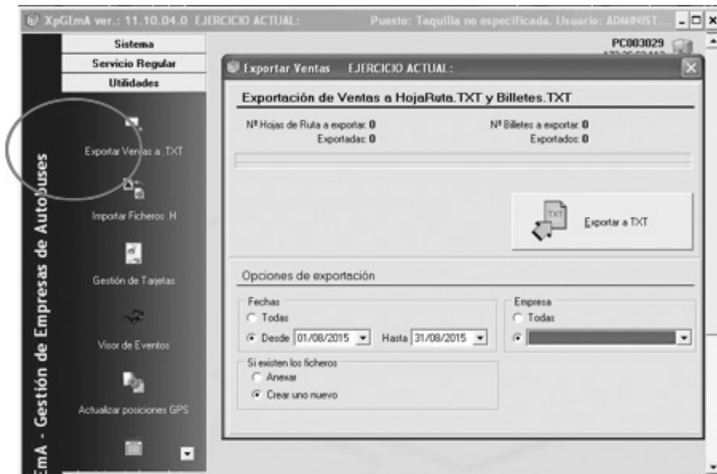
Fig. 2 Exportar Ventas a TXT y al servidor de la Consejería

Para transmitir datos (Fig. 2), desde el menú de Utilidades, se deberá seleccionar Exportar ventas a TXT.