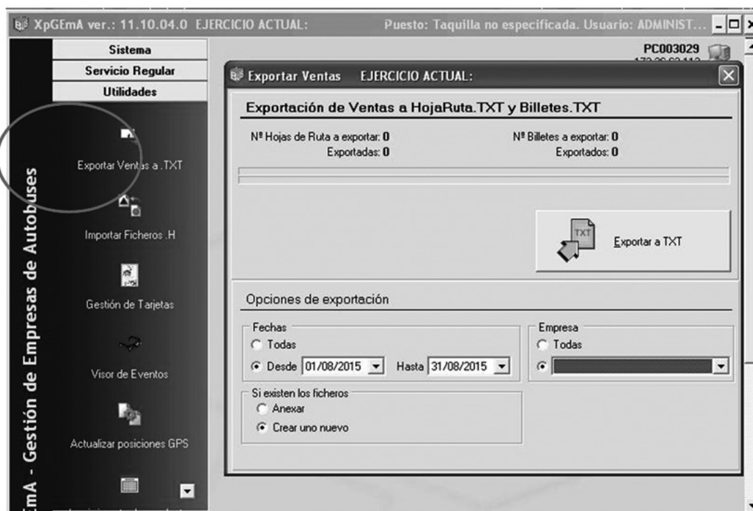
Fig. 2 Exportar Ventas a TXT y al servidor de la Consejería

Para transmitir datos (Fig. 2), desde el menú de Utilidades, se deberá seleccionar Exportar ventas a TXT.