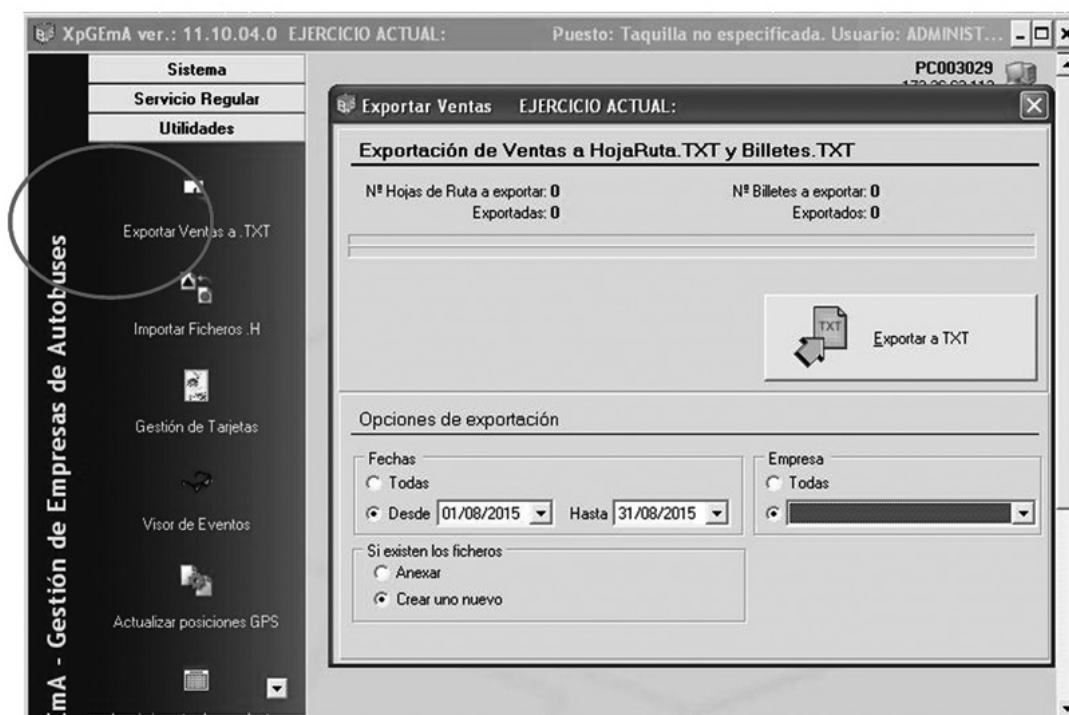
Fig. 2 Exportar Ventas a TXT y al servidor de la Consejería

Para transmitir datos (Fig. 2), desde el menú de Utilidades, se deberá seleccionar Exportar ventas a TXT.