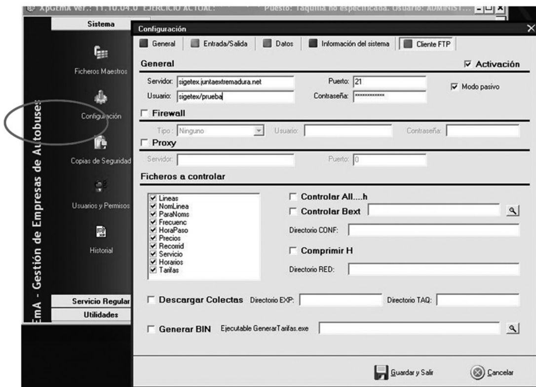
Fig. 1. Configuración de XPGema para transmisión de datos.

(* ) Excepto si está en blanco, realizar la prueba con los valores por defecto.