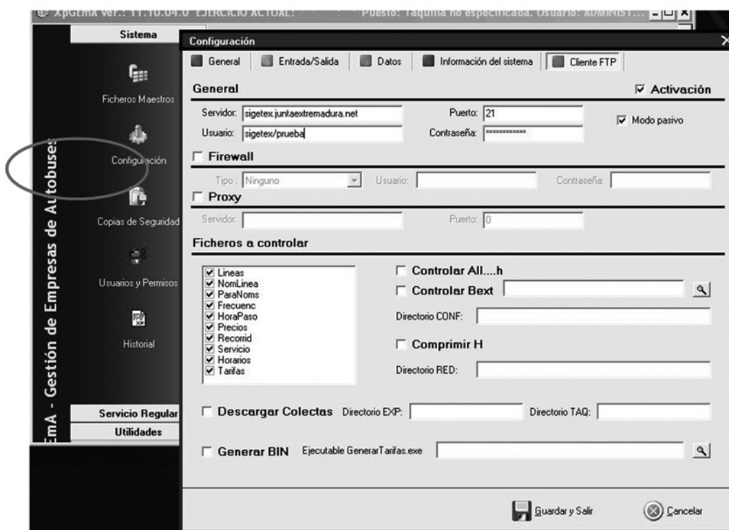
Fig. 1. Configuración de XPGema para transmisión de datos.

(*) Excepto si está en blanco, realizar la prueba con los valores por defecto.