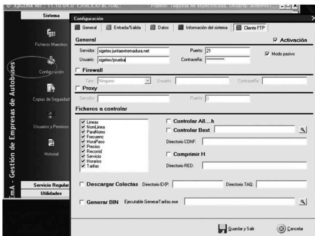
Fig. 1. Configuración de XPGema para transmisión de datos.

(*). Excepto si está en blanco, realizar la prueba con los valores por defecto.