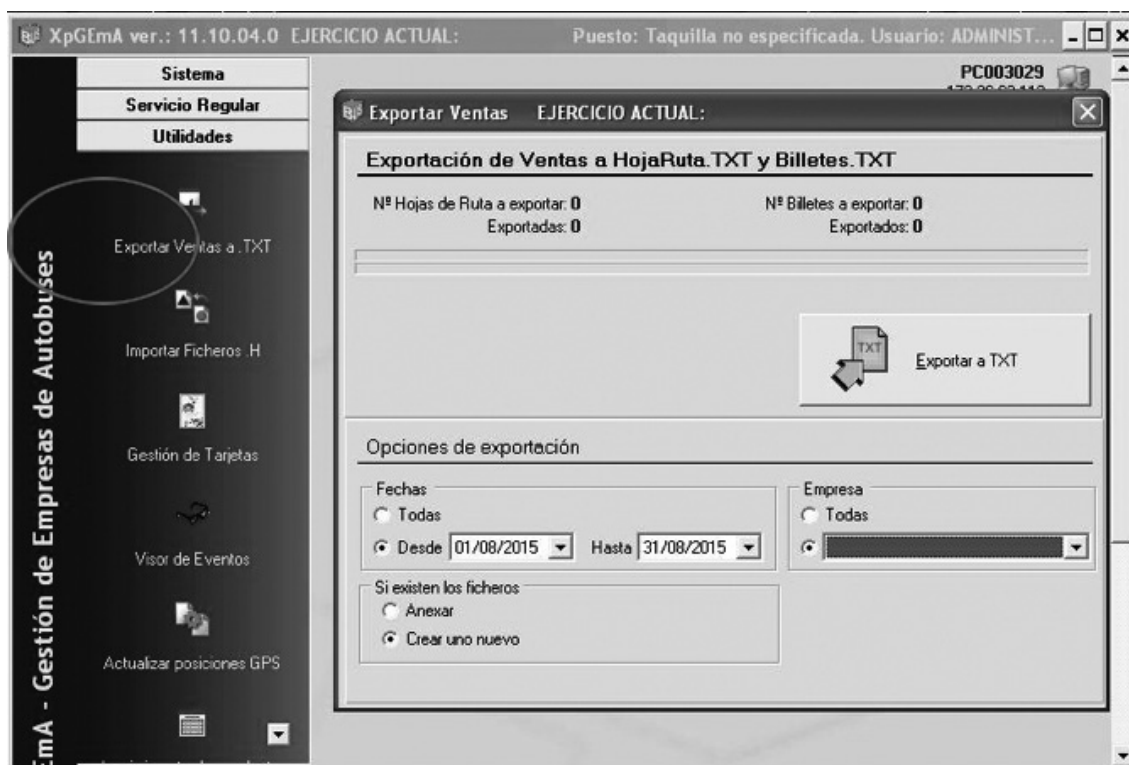
Fig. 2 Exportar Ventas a TXT y al servidor de la Consejería

Para transmitir datos (Fig. 2), desde el menú de Utilidades, se deberá seleccionar Exportar ventas a TXT.