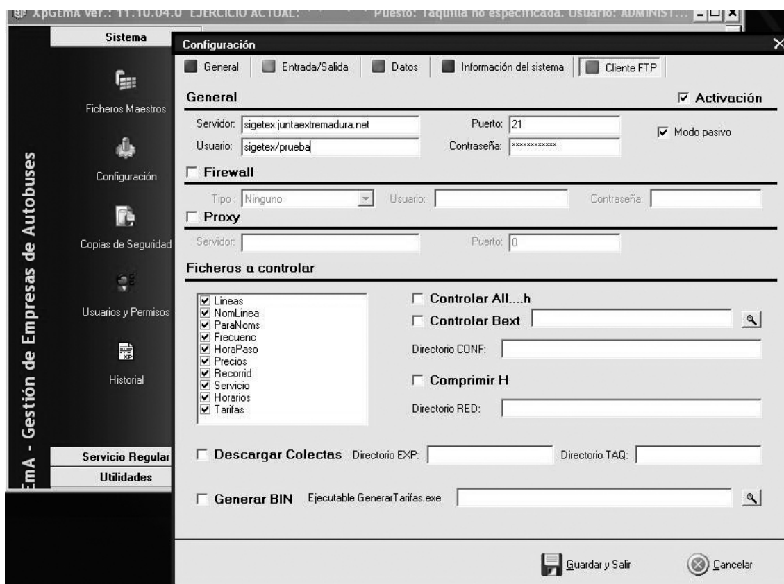
Fig. 1. Configuración de XPGema para transmisión de datos.

(*) Excepto si está en blanco, realizar la prueba con los valores por defecto.