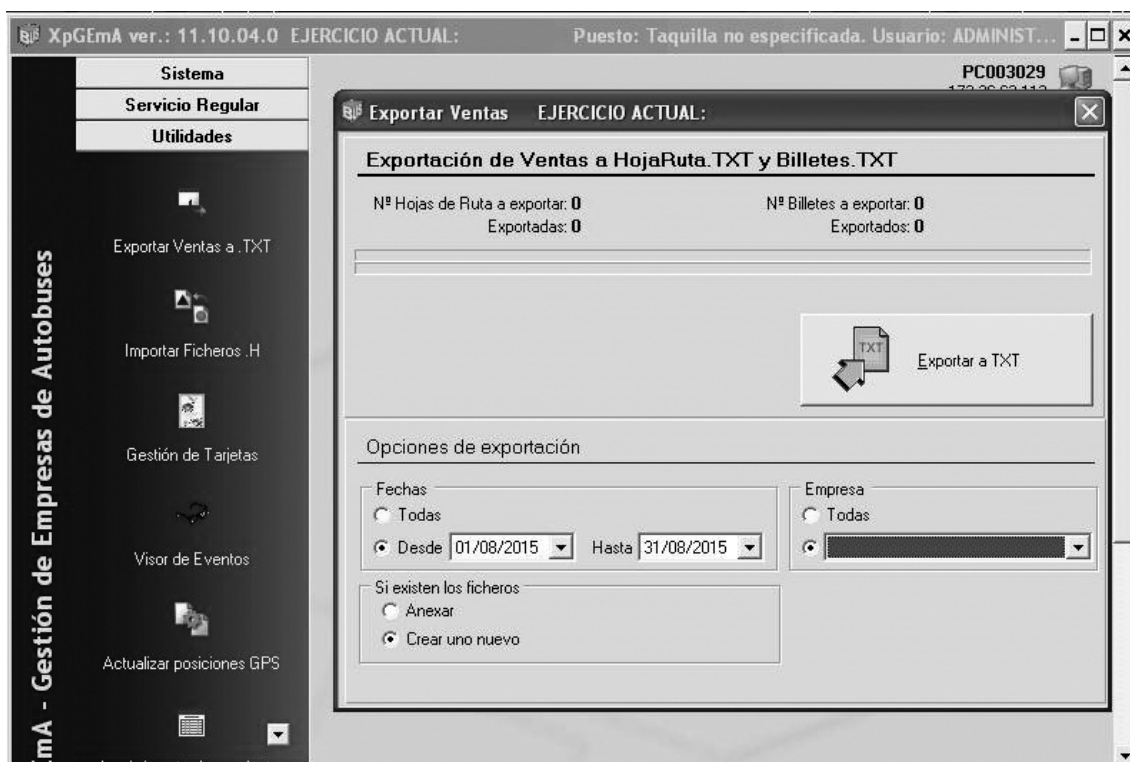
Fig. 2 Exportar Ventas a TXT y al servidor de la Consejería

Para transmitir datos (Fig. 2), desde el menú de Utilidades, se deberá seleccionar Exportar ventas a TXT.