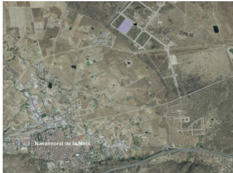
Plano situación complejo industrial