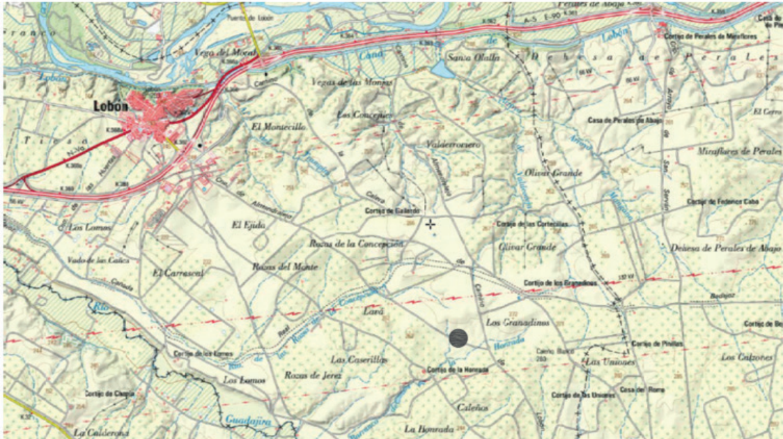
Ubicación de la zona de actuación