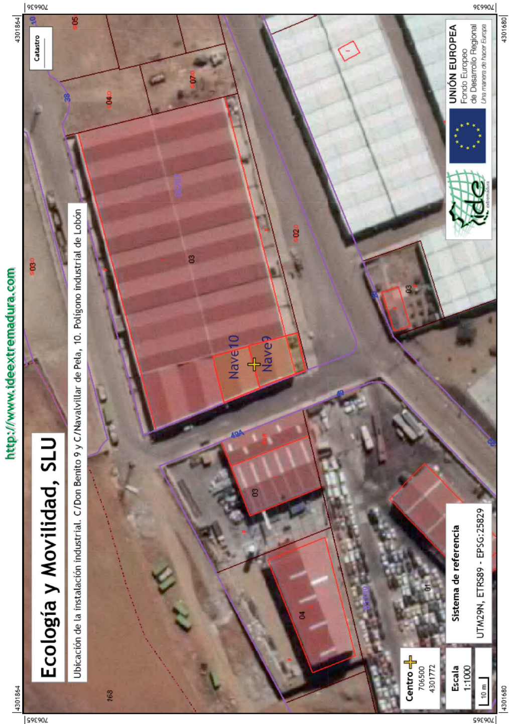
Figura 1. Ubicación de la instalación industrial.