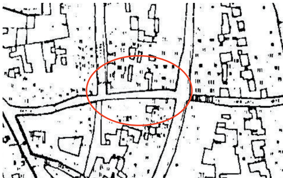
Esquema trazado modificado de alineaciones.

El ajuste de la alineación propuesto en la presente modificación de normativa se adecua a la realidad existente, evitando el ajuste de las edificaciones afectadas y por tanto varían las superficies finales de las parcelas. Así, las superficies de parcelas edificables y, por tanto, su edificabilidad, se ven aumentadas.