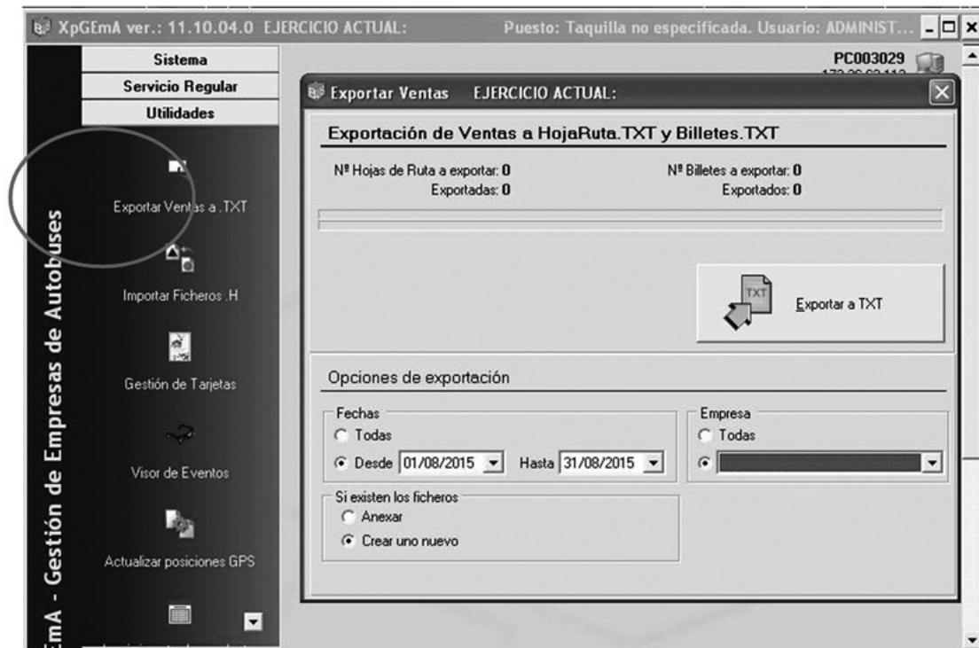
Fig. 2 Exportar Ventas a TXT y al servidor de la Consejería

Para transmitir datos (Fig. 2), desde el menú de Utilidades, se deberá seleccionar Exportar ventas a TXT.