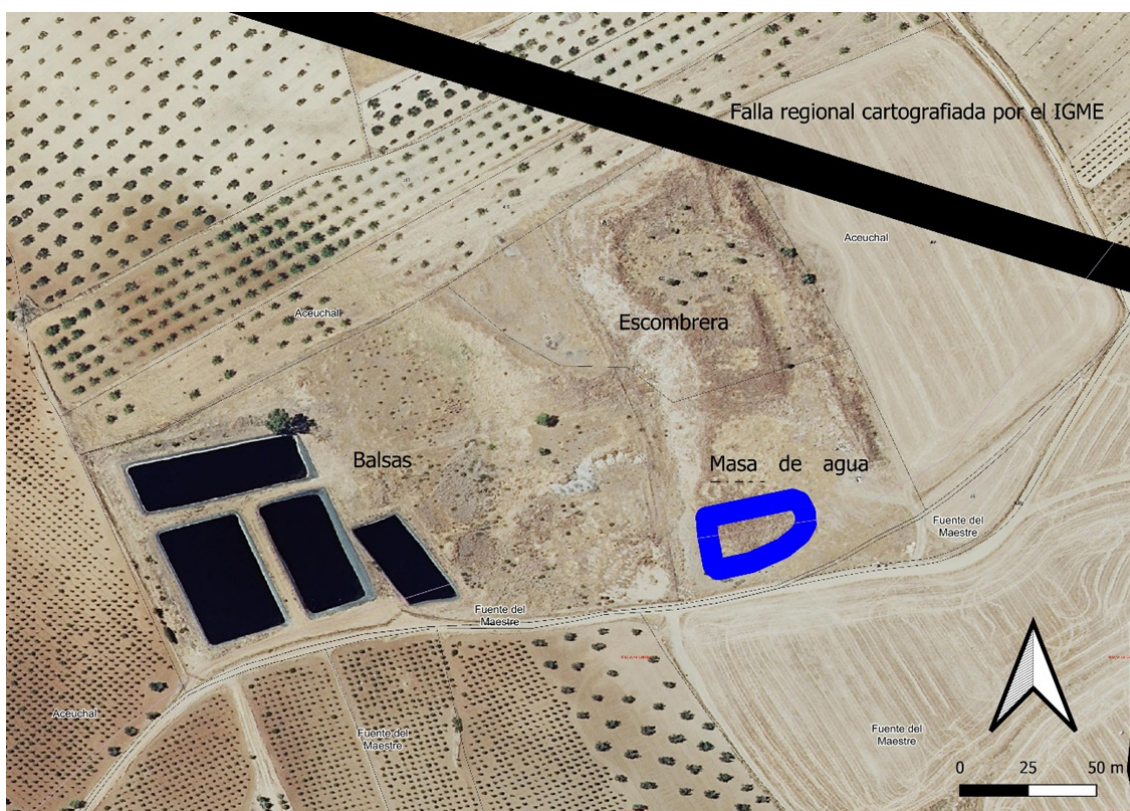
F2. Imagen de la ubicación de la parcela con las 4 balsas de evaporación con la cartografía hidrogeológica y geológica del IGME con la antigua masa de agua al norte de la parcela. Visualizado y exportados por el software QGIS.

El emplazamiento en el que se encuentra la presente actividad de la parcela donde se localizan las balsas es el polígono 013, parcela 421 de Aceuchal (Badajoz), con una superficie de parcela de 33,659 m 2 . De esta superficie, las balsas se encuentran en la zona sur. La zona norte esta colindante con una antigua escombrera.