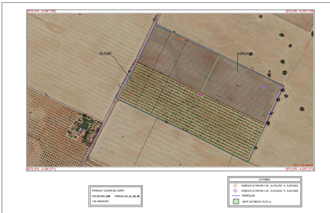
Parcelas zona de actuación y ubicación de pozos.

Las plantaciones ocupan la práctica totalidad de las citadas parcelas. La zona de actuación está situada a unos 5,2 km al sur del casco urbano de Badajoz, aunque tiene más próximas zonas de segundas residencias y urbanizaciones del entorno de la ciudad. El acceso a la finca es desde un camino que parte de la carretera EX-107, de Badajoz a Olivenza, que está a unos 2 km al oeste.