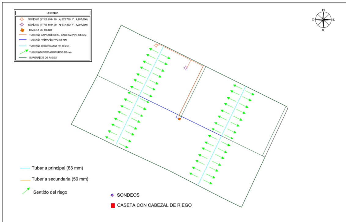
Red, infraestructuras y sectores de riego.

Las necesidades hídricas del cultivo se calculan en un total de 17.096,13 m 3 /año, que coincide con lo solicitado al órgano de cuenca, de los que 8.908 m 3 /año son para el olivar y 8.187,94 m 3 /año para el viñedo, siendo la temporada de riegos entre abril y septiembre.