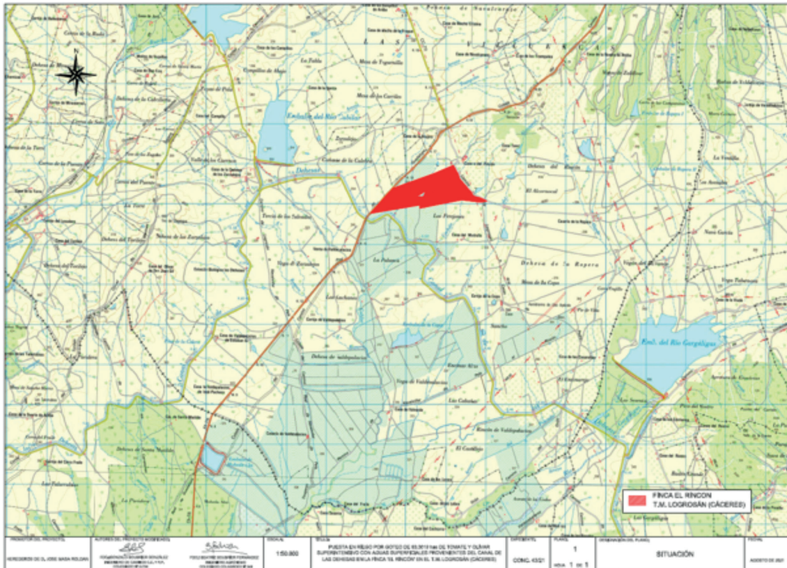
Ubicación de la zona de actuación.