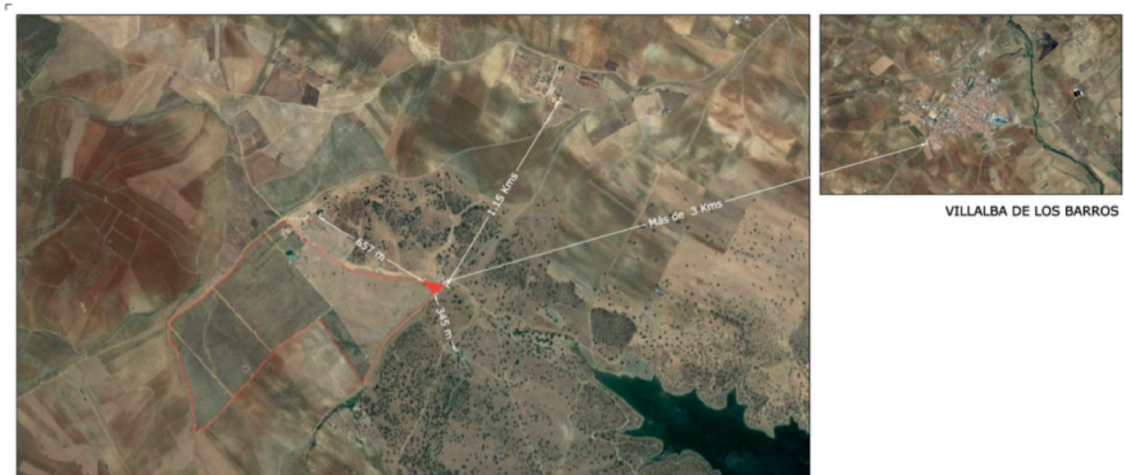
Fig. 1. Ubicación