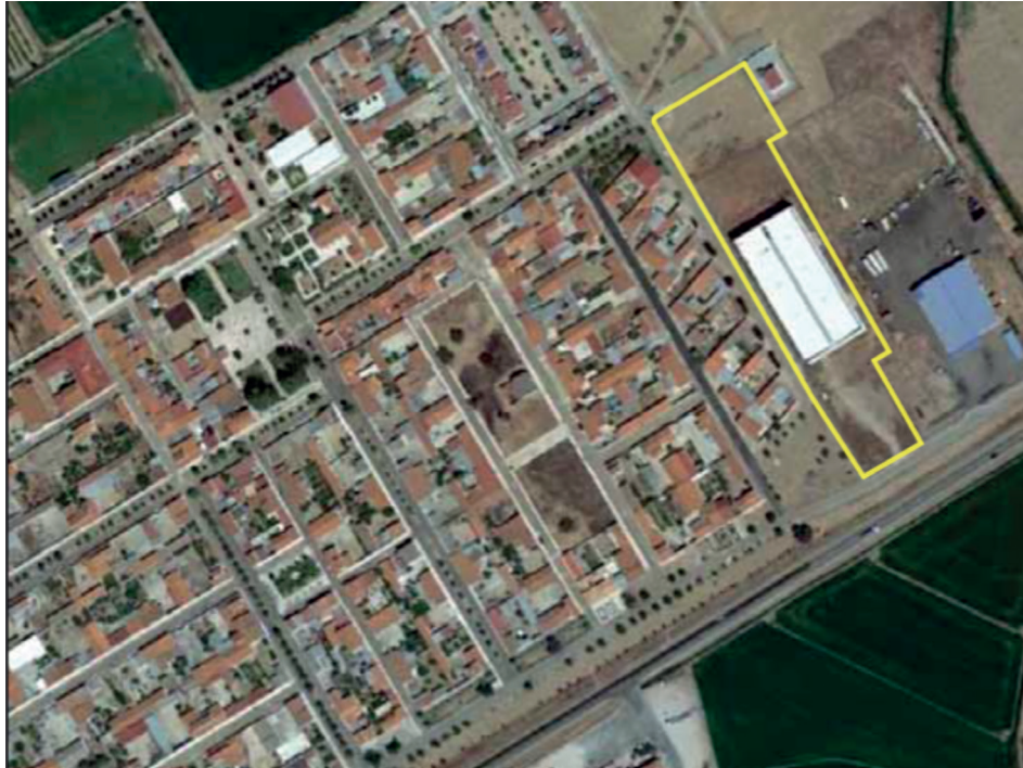
Fig. 1. Ubicación