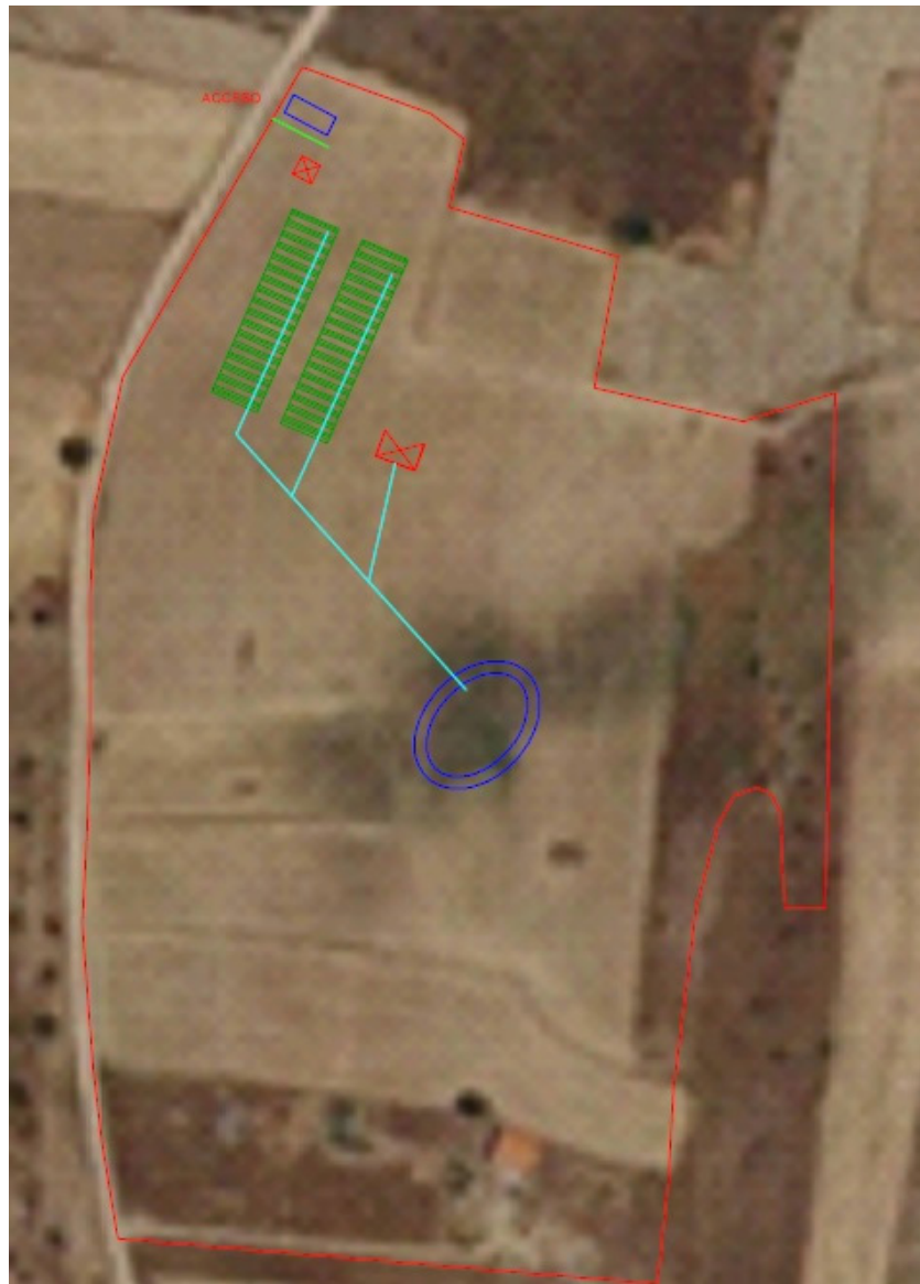
Fig. 1. Planta general de las instalaciones.