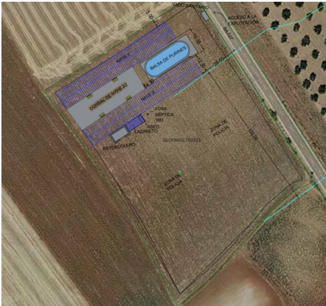
Fig. 1. Planta general de las instalaciones.