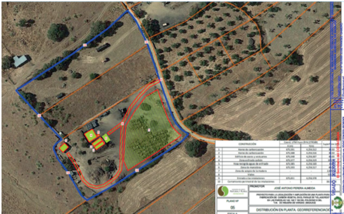
Figura 1. Plano en planta de las instalaciones