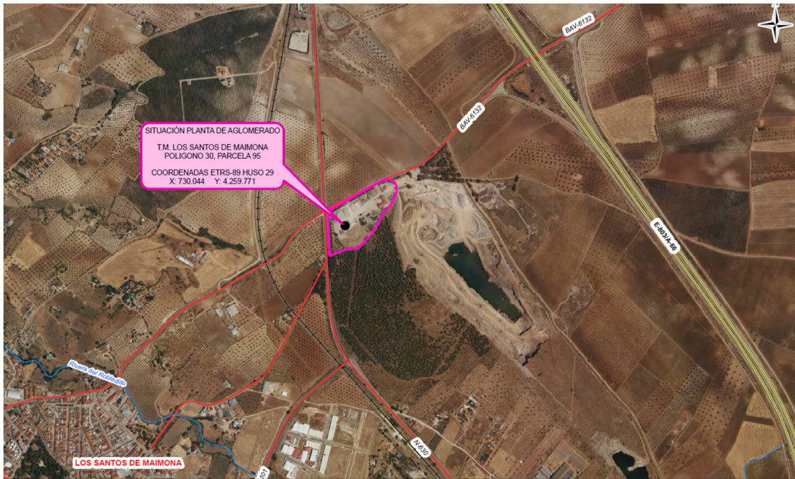
Fig. 1. Ubicación