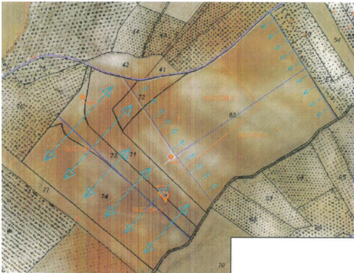
Red de distribución, instalaciones y sectores riego