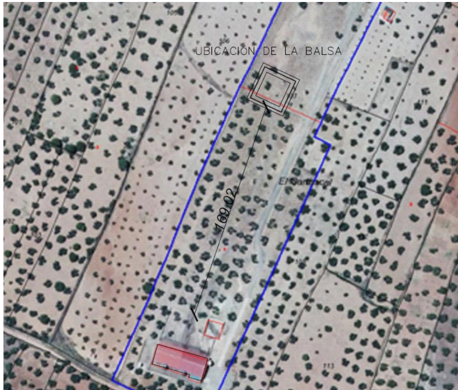
Fig. 1. Planta general de las instalaciones.