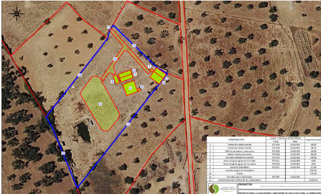
Plano en planta de las instalaciones