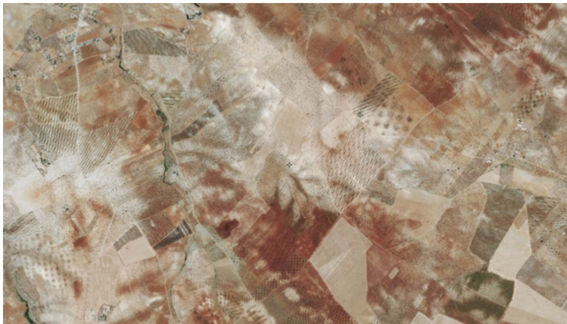
Situación de la zona de actuación.

urbano de Ribera del Fresno. La explotación está enclavada en una zona de clara vocación agrícola donde predominan el cultivo de olivos y viñas alternando con algunas manchas de pastos arbustivos entre las tierras arables, siendo el uso del suelo actual correspondiente a la categoría de agrícola de secano.