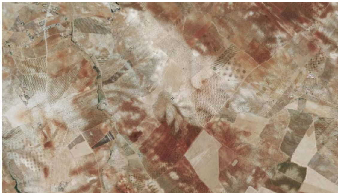
Situación de la zona de actuación.

urbano de Ribera del Fresno. La explotación está enclavada en una zona de clara vocación agrícola donde predominan el cultivo de olivos y viñas alternando con algunas manchas de pastos arbustivos entre las tierras arables, siendo el uso del suelo actual correspondiente a la categoría de agrícola de secano.