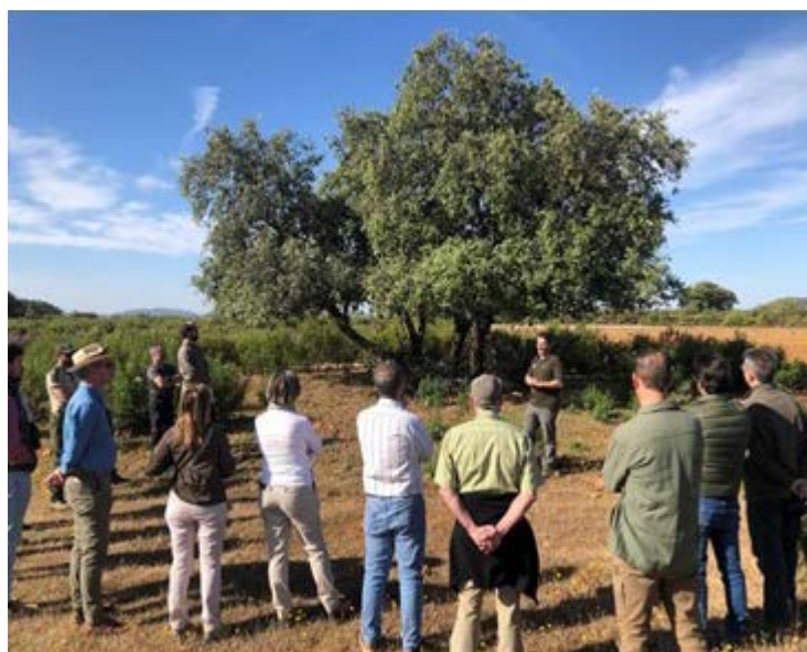
Foto 2. Visita a un coto en la comarca de la Siberia en 2024.

Propuesta 6: visitas a cotos que realizan gestión activa y sostenible de la tórtola.