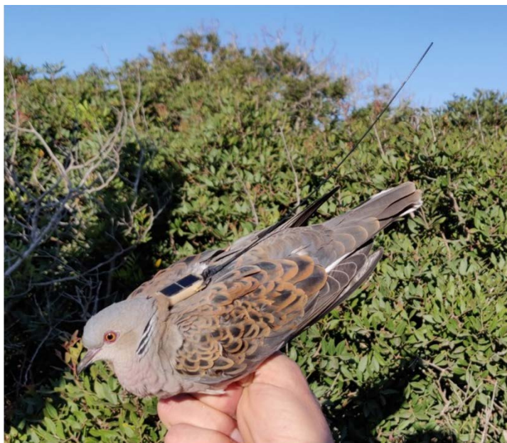
Foto 3. Tórtola marcada con dispositivo GPS.

A su vez se plantea la necesidad de realizar estudios de seguimiento de tórtolas durante su reproducción mediante telemetría en un coto escogido para tal fin en Extremadura.