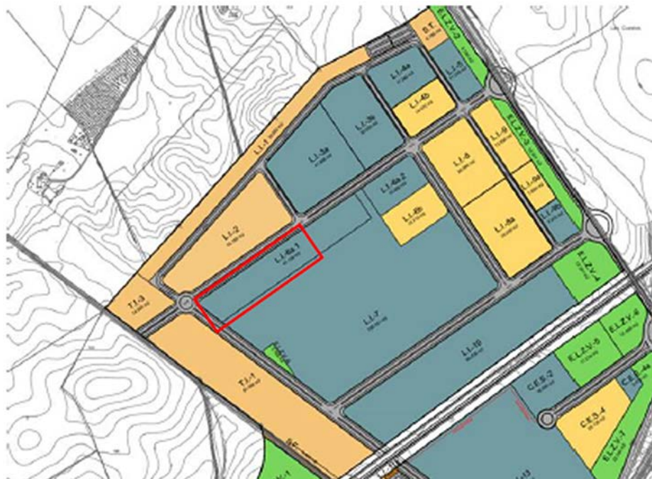
Imagen 1: Ubicación del proyecto

La actividad proyectada se situará en el Polígono Industrial Plataforma Logística Suroeste Europeo de Badajoz, parcela L.I.-6A-1 (Referencias Catastrales: 2788606PD-7028H0001QU, 2788601PD7028H0001WU). Coordenadas UTM (ETRS89 Huso H29) X= 96166,70 Y=10046,30.