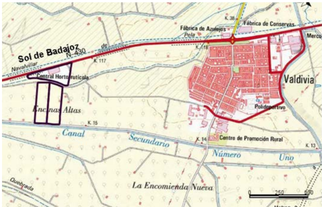
Fig. 1. Ubicación