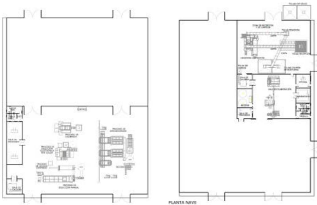
Fig. 3 Y 4 Equipos Planta de almendras y Planta de almazara