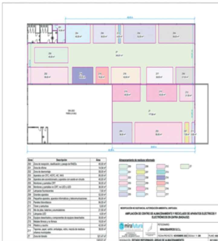
2. Plano de distribución