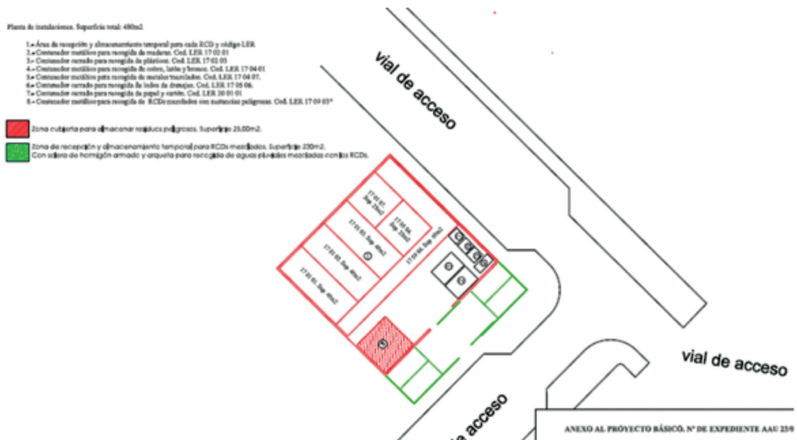
Plano en planta de la instalación