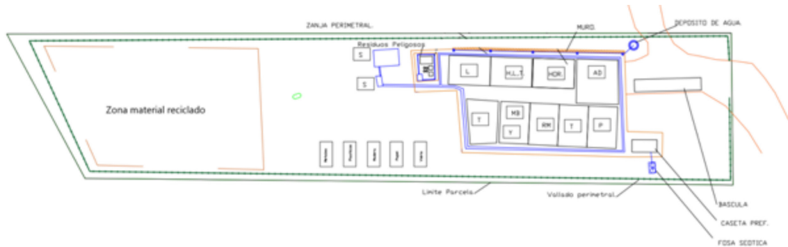
Figura 2: Distribución

Los residuos no peligrosos gestionados en la planta de almacenamiento y gestión de RCD objeto de este informe se corresponden con los siguientes códigos LER: