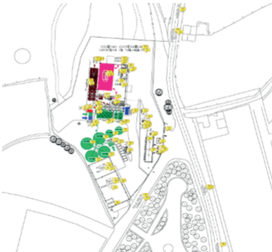
Fig. 1. Infraestructuras y equipos