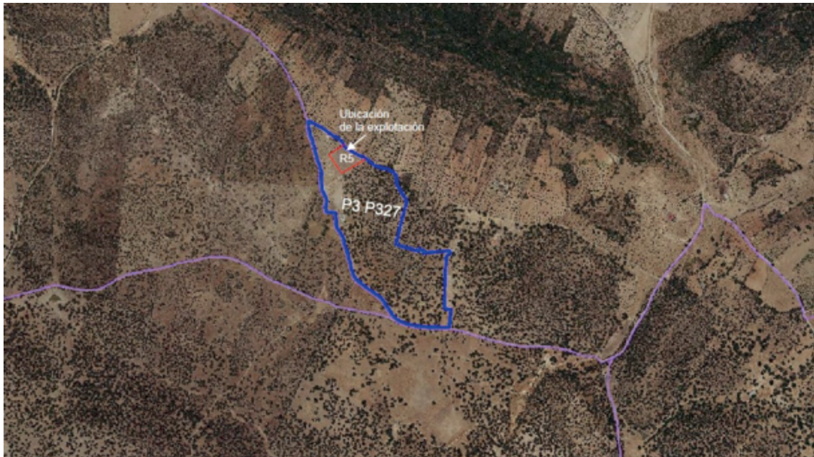
Fig. 1. Planta general de la ubicación.