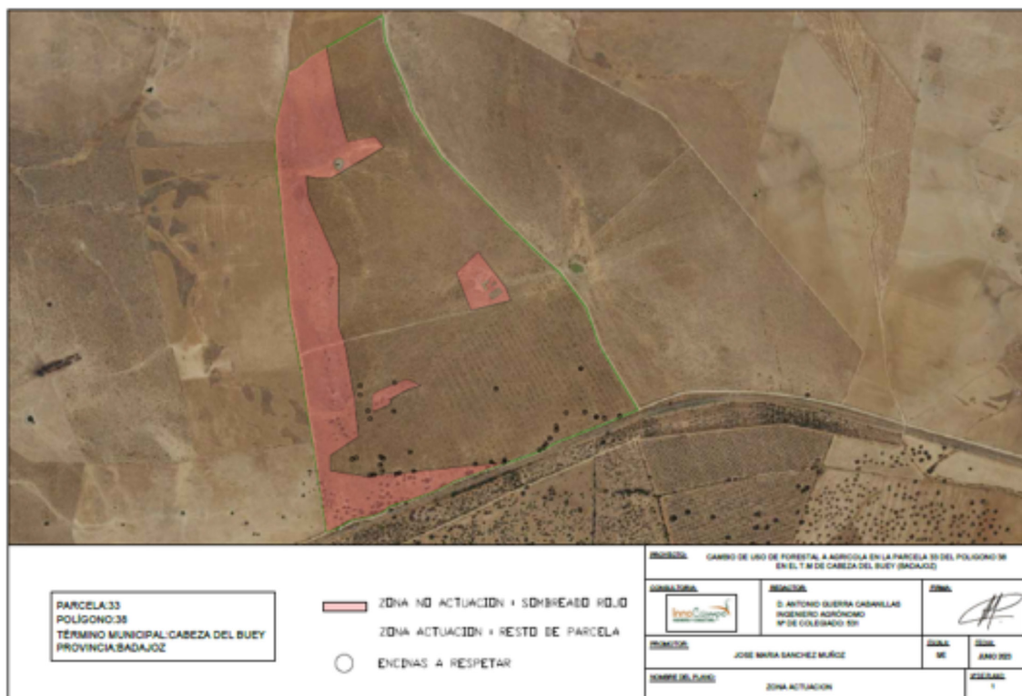
Plano 2. Localización zona de actuación.

A continuación, se describen las actuaciones a realizar: