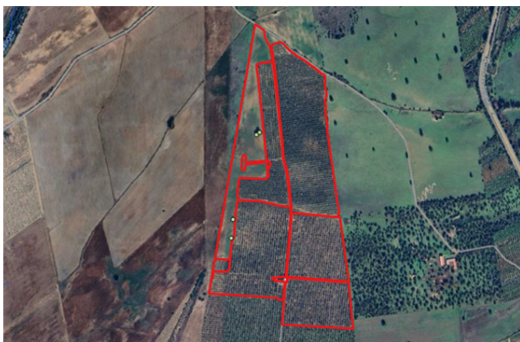
Situación del arbolado autóctono existente a respetar

Esta Dirección General considera que la afección de la plantación y puesta en riego de olivar es asumible, si bien debe respetarse el arbolado adulto (diámetro normal >15 cm) existente, al tratarse de ejemplares adultos con un estado fitosanitario y estructural aceptables, ya que aunque su presencia pueda suponer molestias y pérdidas desde un punto de vista meramente productivo, se considera que son asumibles por los beneficios medioambientales que también aportan y que su existencia es compatible con el cultivo.