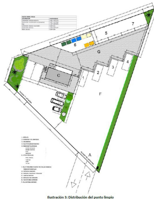
Ilustración 3: Distribución del punto limpio