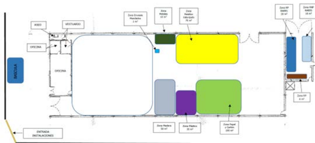
Figura 2: Plano de distribución de superficies.