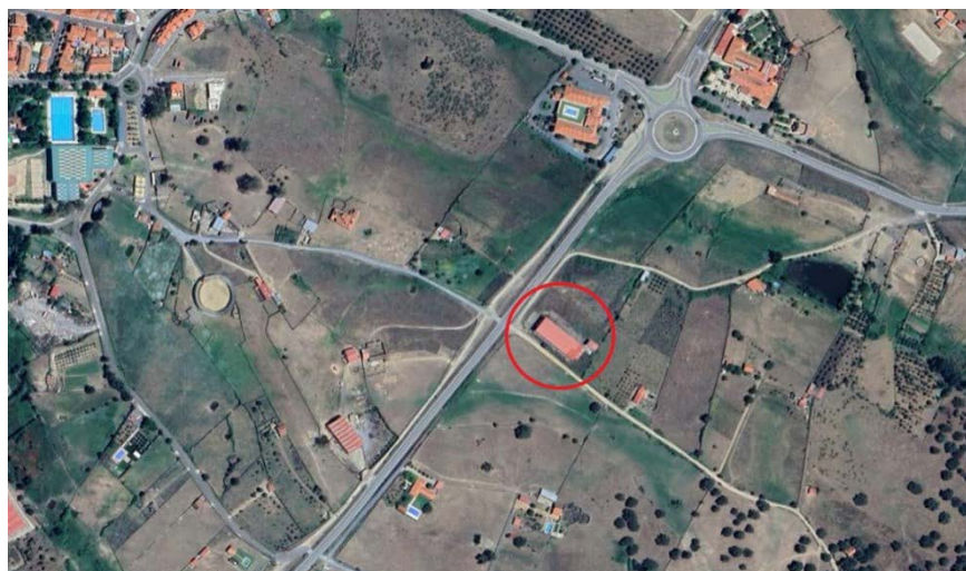
Figura 1: Emplazamiento de proyecto.

La actividad se ubicará en una nave situada en polígono 29, parcela 65, de Malpartida de Plasencia (Cáceres). El acceso, se realiza a través de la carretera EX108. La referencia catastral de la parcela es: 10119A029000650000FO.