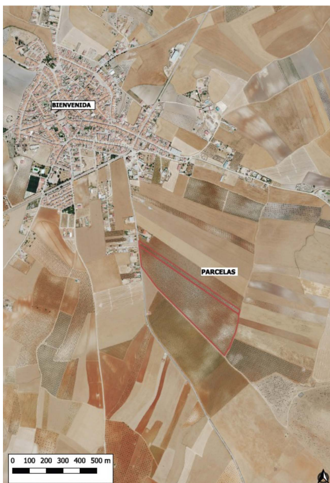
Plano 1: Plano general de emplazamiento.

Por otra parte, a la Dirección General de Infraestructuras Rurales de la Consejería de Gestión Forestal y Mundo Rural, le corresponde la planificación de los recursos hidráulicos con interés agrario, dentro del ámbito de competencias propio de la Comunidad Autónoma. También las competencias derivadas de la aplicación de la Ley 6/2015, de 24 de marzo, Agraria de Extremadura, en relación con las actuaciones en materia de regadíos.