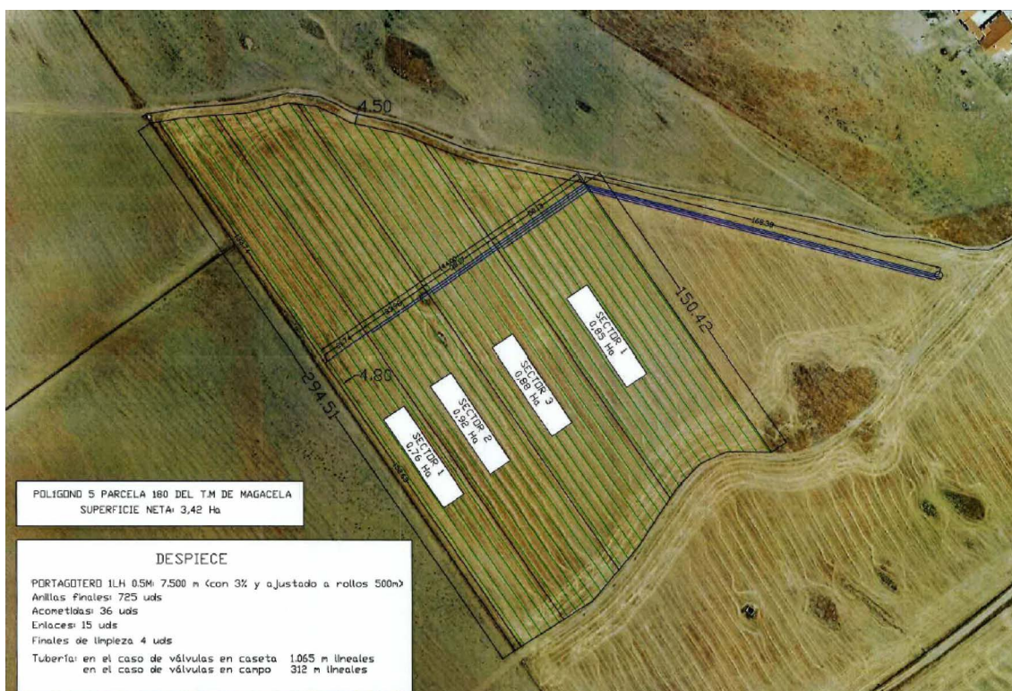
Distribución de los sectores de riego