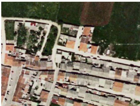
Ortofoto PNOA Extremadura 2006