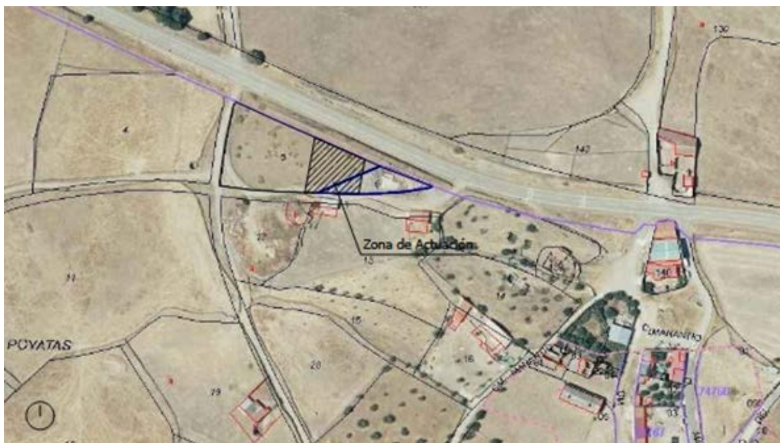
Localización del punto limpio.

El terreno es propiedad del Ayuntamiento de Membrío y está localizado a las afueras de la localidad, junto a la carretera CC-312 en las parcelas 5 y 6 del polígono 33, paraje Las Poyatas, con referencias catastrales 10122A033000050000FF y 10122A033000060000FM respectivamente. La extensión de la instalación son 646 m 2 .