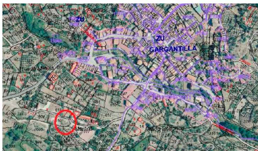
Localización del punto limpio.