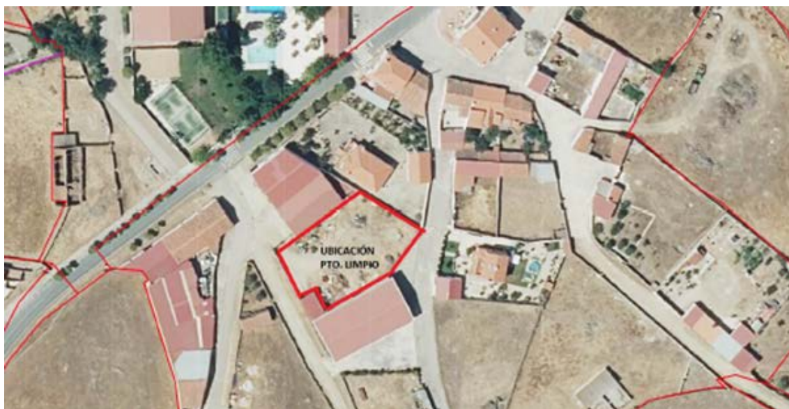
Localización del punto limpio.

El objetivo del proyecto es la construcción de una nueva instalación para poder dar un servicio adecuado de punto limpio, recibiendo los residuos municipales de aparatos eléctricos y electrónicos, pilas y baterías, lámparas y voluminosos.