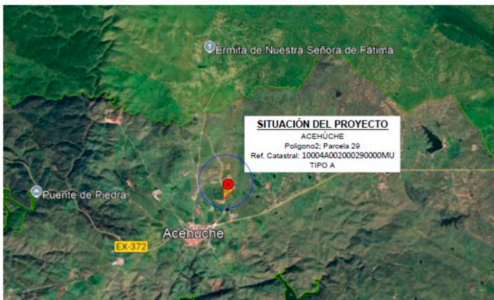
Localización del punto limpio.

El punto limpio proyecto es del tipo A (215m 2 ) y está constituido por una única plataforma; con conexión rodada desde la misma entrada. Se construirá una garita o caseta que podrá utilizar el personal para el registro de las entradas. Dispondrá de un aseo con ducha y despacho o zona de trabajo. Las vías de acceso no están pavimentadas pero tienen anchura suficiente para el tránsito de vehículos.