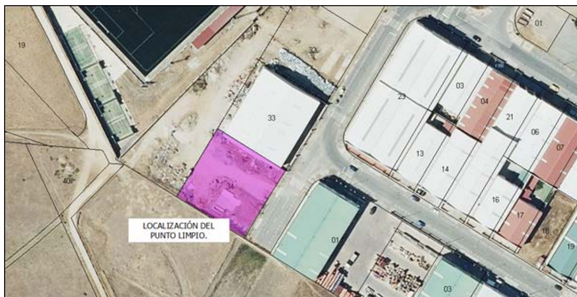
Localización del punto limpio.

El objetivo del proyecto es la construcción de un punto limpio de tipo B para la recogida selectiva de residuos domésticos con el fin de mejorar la gestión de residuos en el municipio de Arroyo de la Luz. Esto conlleva la construcción de un recinto de 1623 metros cuadrados de superficie, para albergar los diferentes contenedores para la recogida de residuos. Las obras y características del punto limpio son las que a continuación se describen.