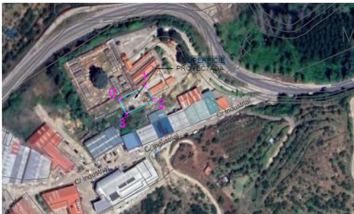
Localización del punto limpio.

El punto limpio proyectado está constituido por una sola plataforma con solera de hormigón armado. Se construirá un edificio de control que dispondrá de aseo con ducha, zona de trabajo y almacén.