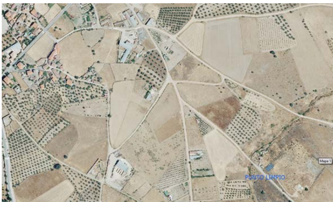
Localización del punto limpio.